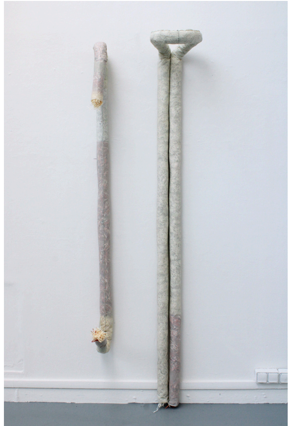
De gauche à droite : L'emprise et L'obéissance, 2025

Ces tubes fourrés par des papiers découpés en lamelles sont cousus en bâche. La couture devient un acte de contention et une aide pour empêcher le débordement. L'enveloppe coercitive rappelle la forme des intestins, accru par l'emploi des couleurs du corps ou de ce qui le compose comme le rouge, le beige ou le jaune. L'aspect viscéral de ces pièces et l'utilisation de matières considérées comme déchets sont liées au concept de l'abject.