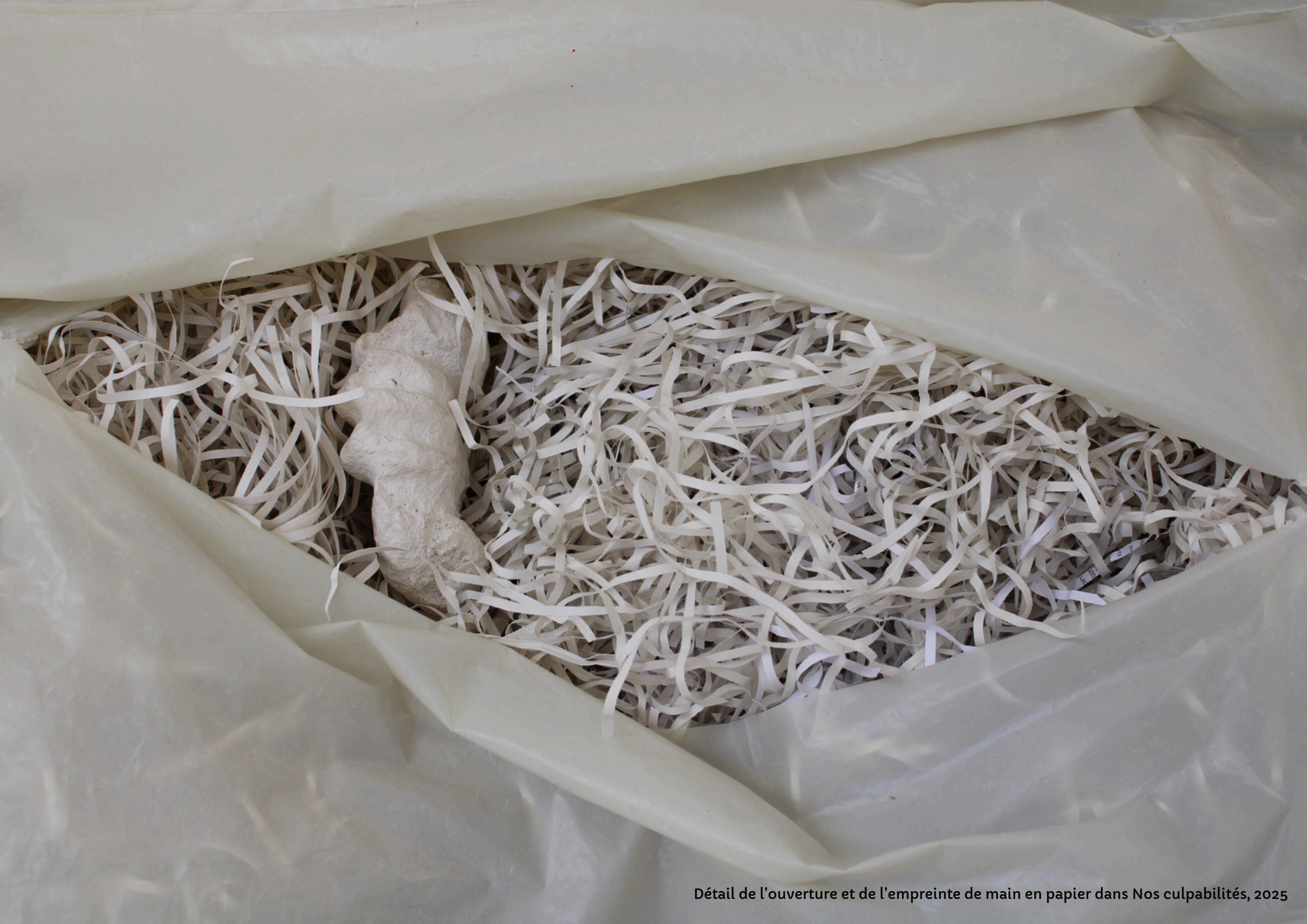
Détail de l'ouverture et de l'empreinte de main en papier dans Nos culpabilités, 2025