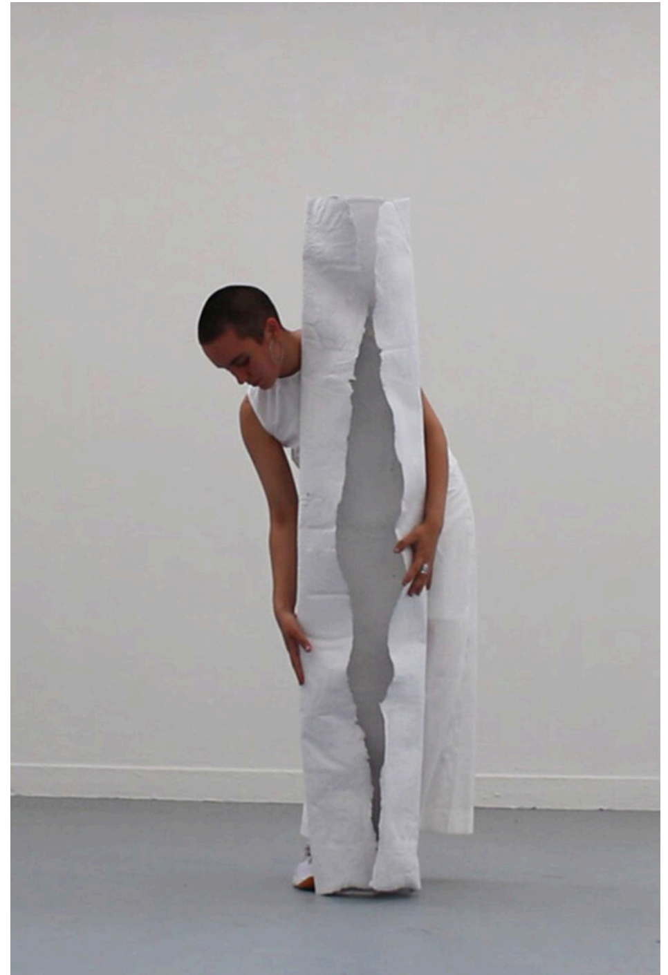
Photo de la performance Permissions, 2025