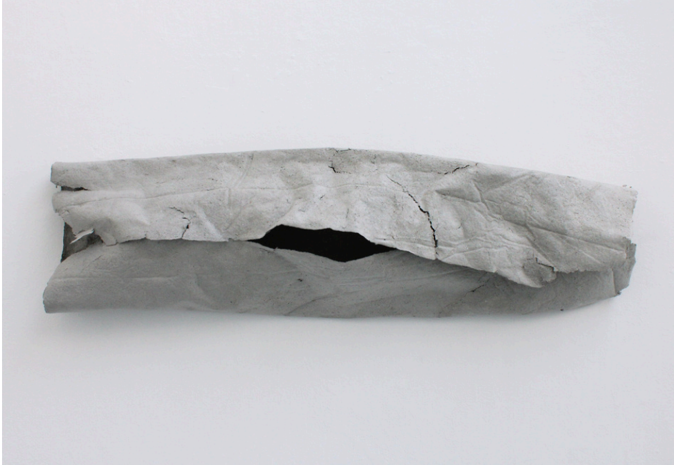
Une des sculptures de la série Permissions, 2025

Cette installation est réalisée en concomitance avec l'architecture du lieu et du nombre de Permissions.