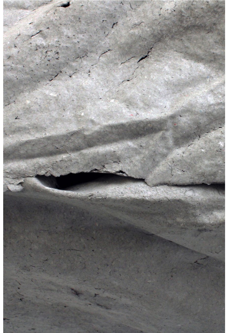
Détail de l'extérieur d'une Permission, 2025