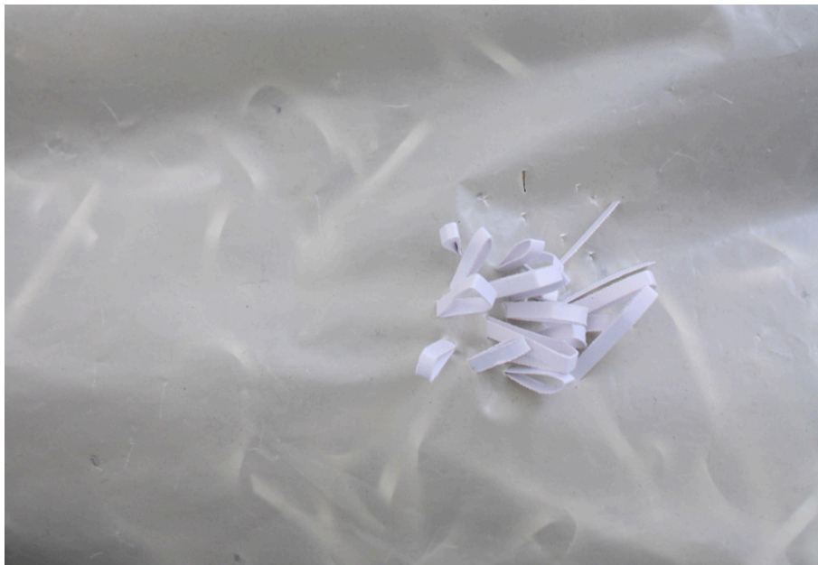
Détail de Nos culpabilités, 2025

Un unique élément corporel apparaît : une empreinte de main disposée dans la fente découpée sur le dessus de la bâche. Partie du corps qui saisit et touche, elle est fabriquée avec le même papier que celui entassé à l'intérieur. Comme si, de cette matière, devait advenir une forme.