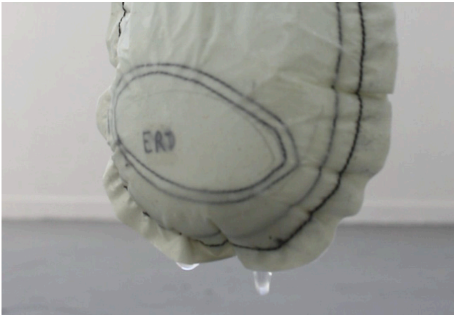
Détail de l'eau qui goutte de l'Omerta, 2025

De l'eau coule à l'intérieur de L'Omerta qui perle à sa surface et goutte lentement. Les superpositions de bâche et les coutures exercent une retenue momentanée.