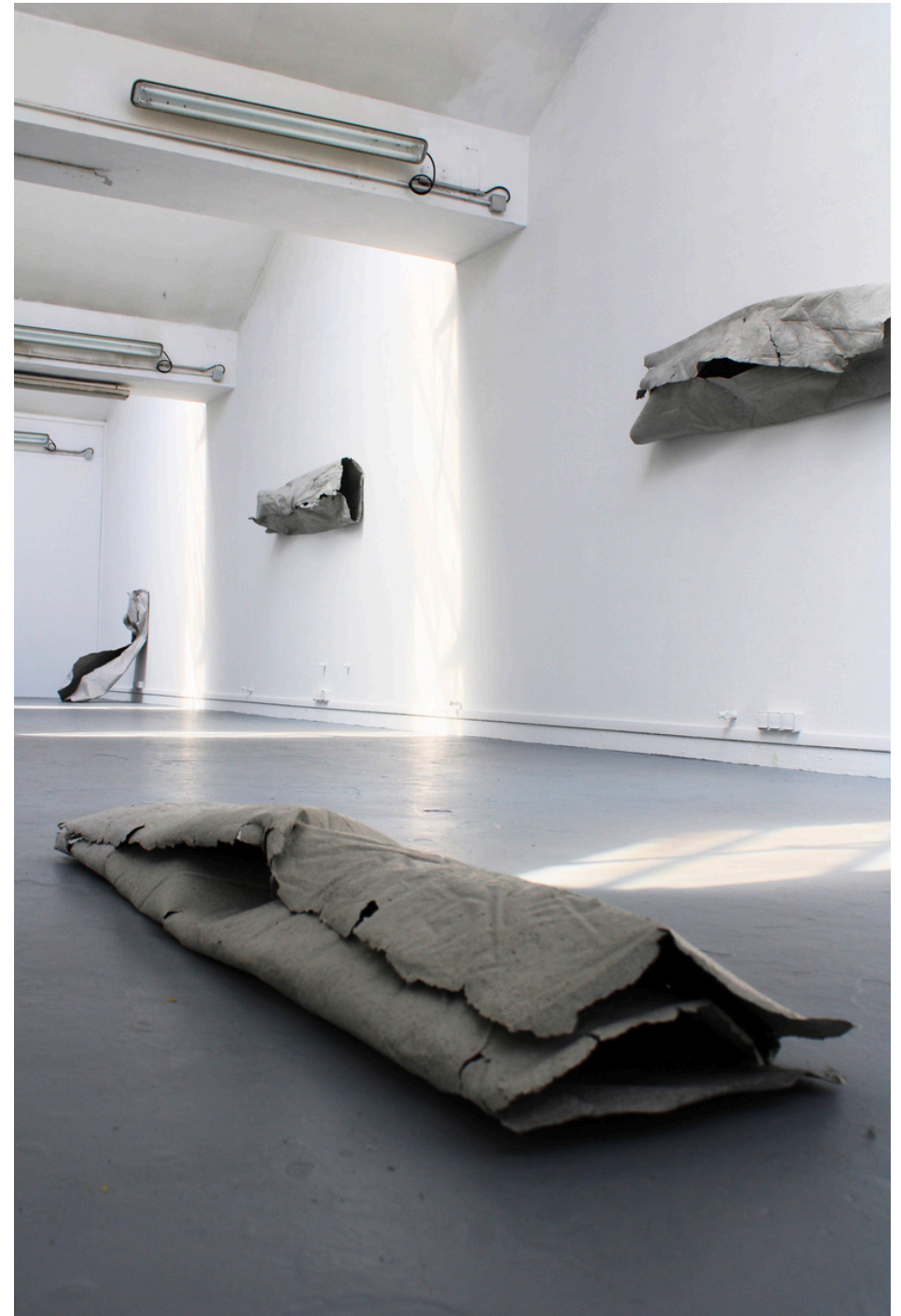
Vue d'installation, Beaux-arts de Paris, 2025