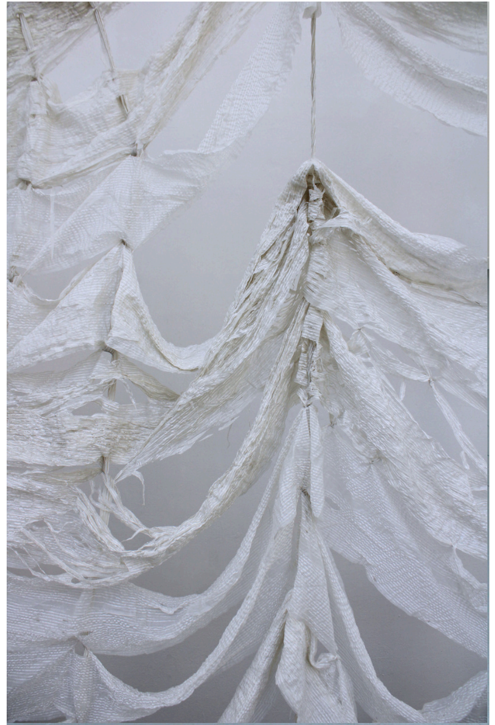
Détail de L'attente, 2025