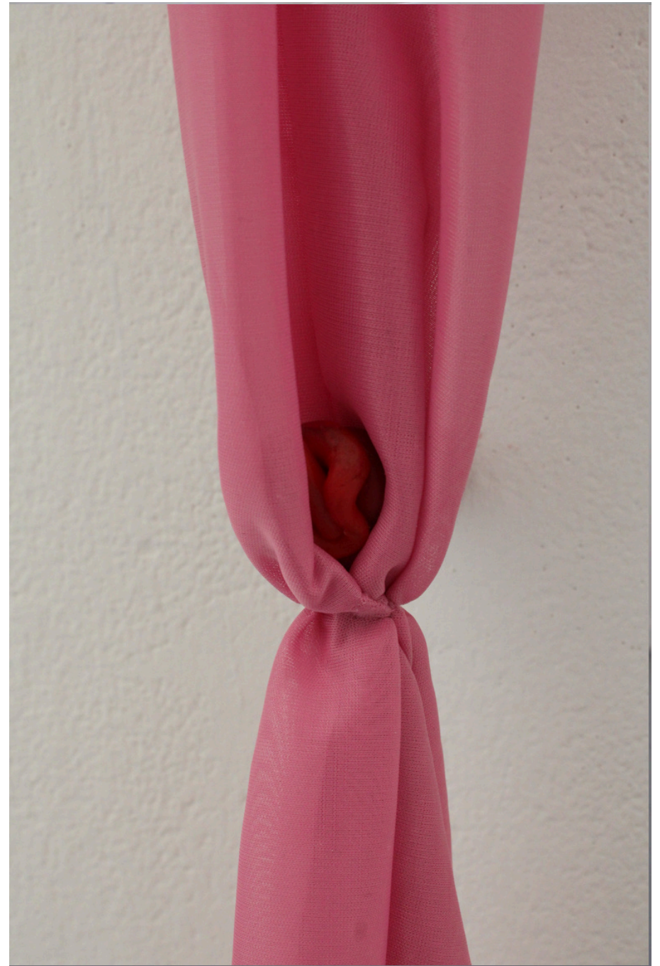
Détails de Mon secret, 2025