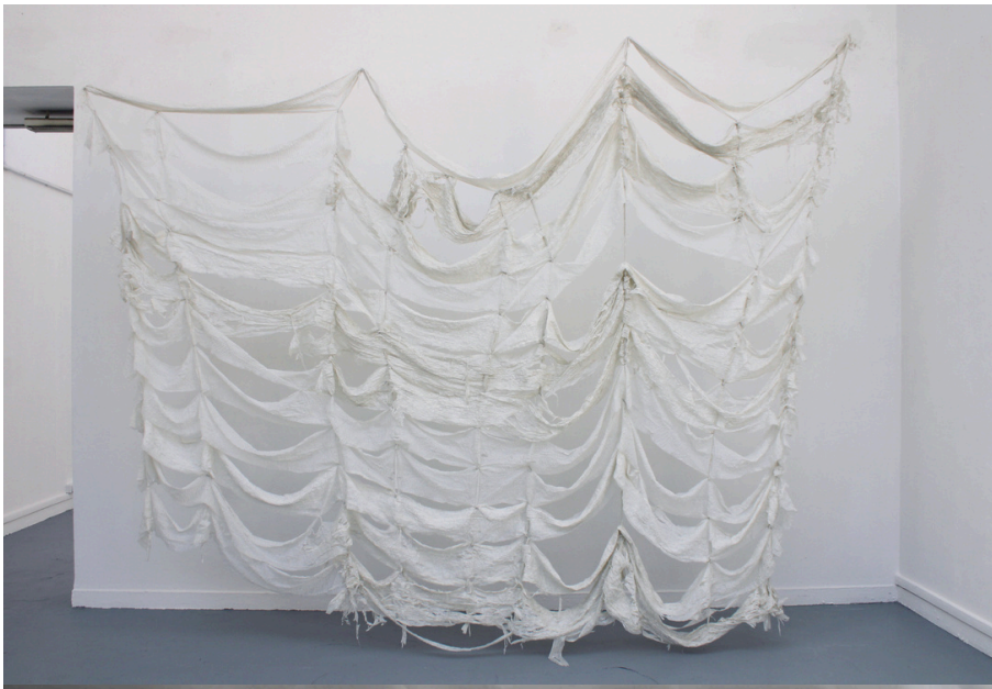
Vue d'ensemble de l'Attente, 2025

Suspendue, la sculpture joue entre tension et relâchement, produisant une impression de poids malgré la légèreté du matériau.