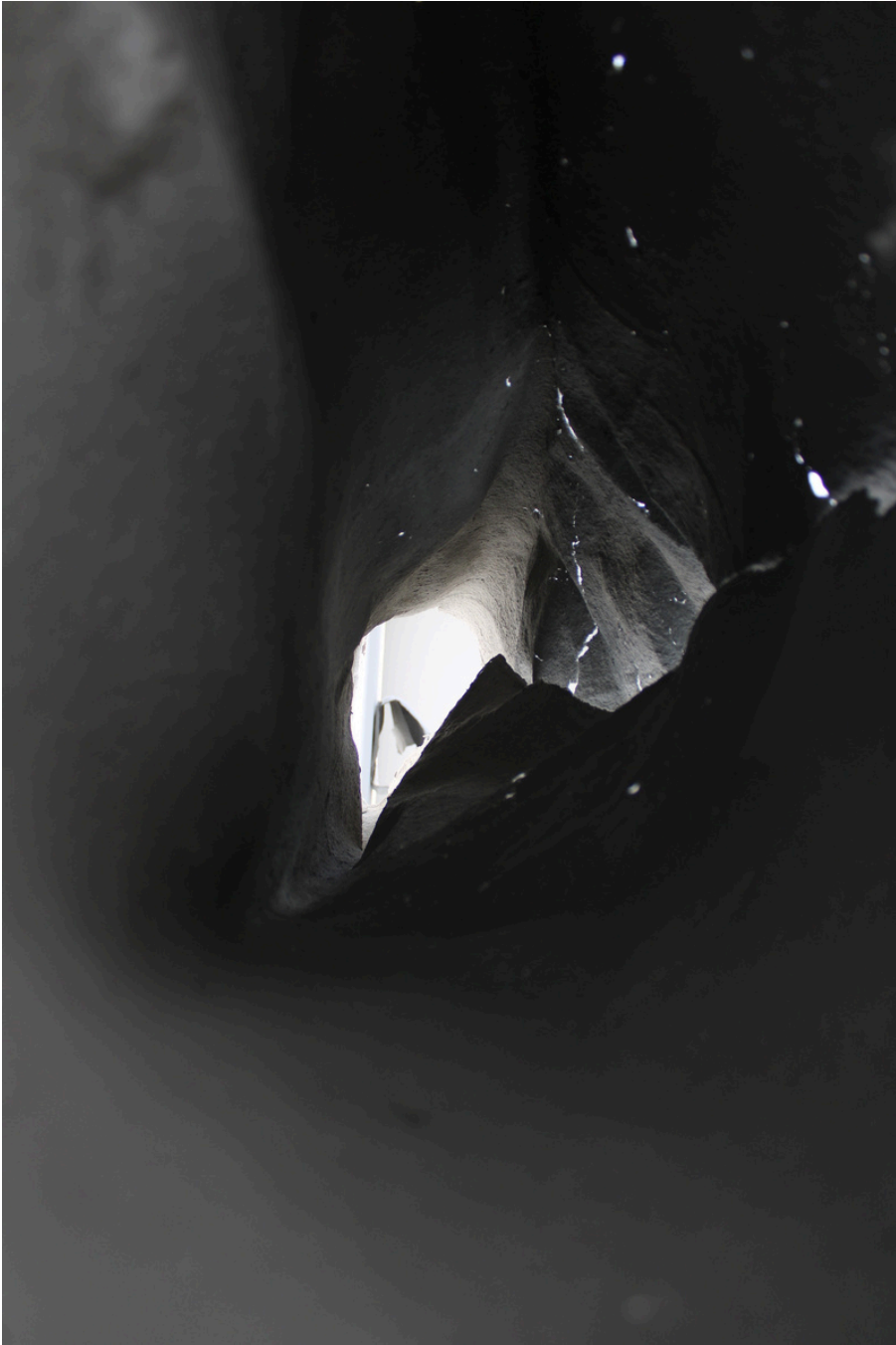
Détail de l'intérieur d'une Permission, 2025