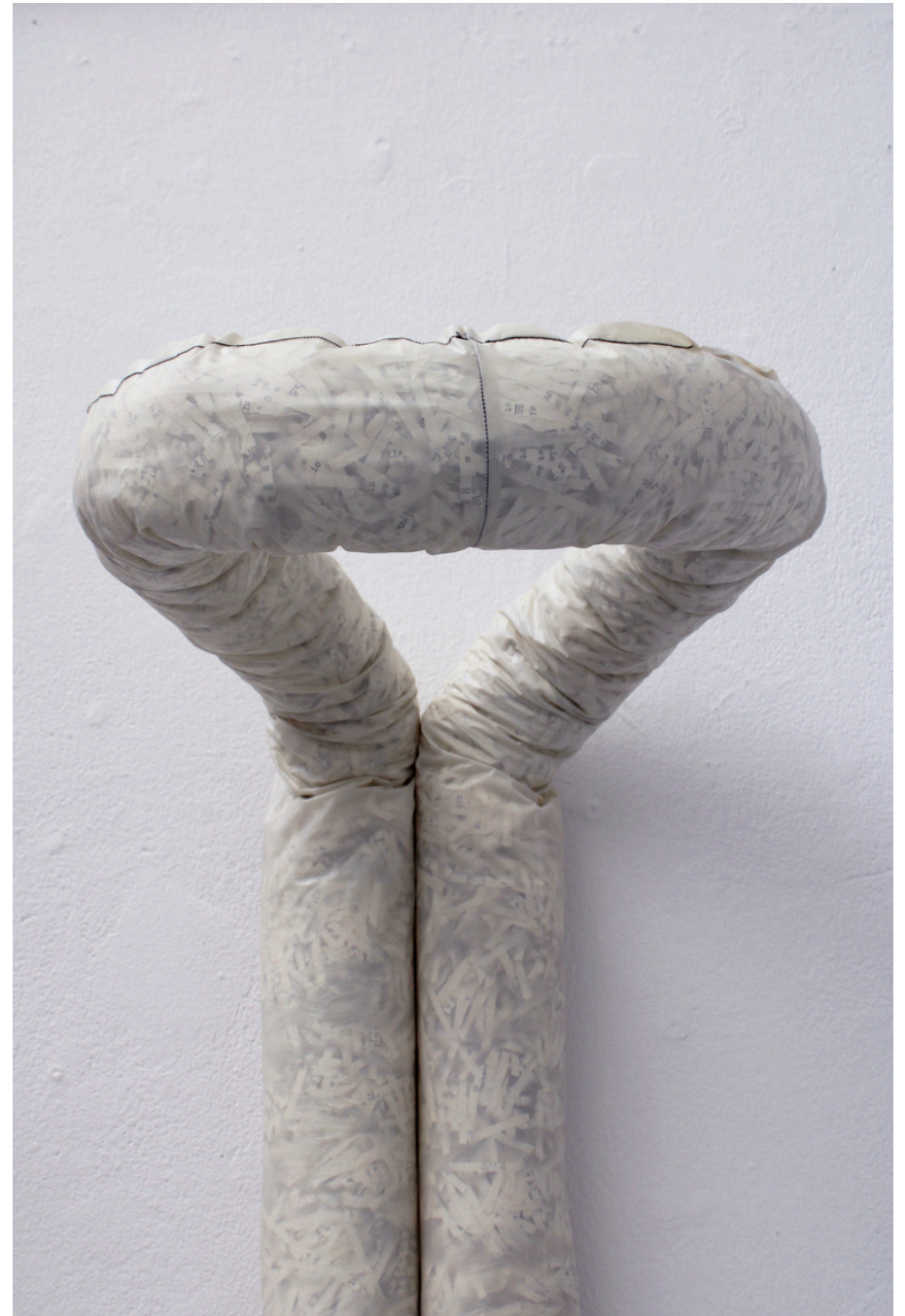
Détail de L'obéissance, 2025