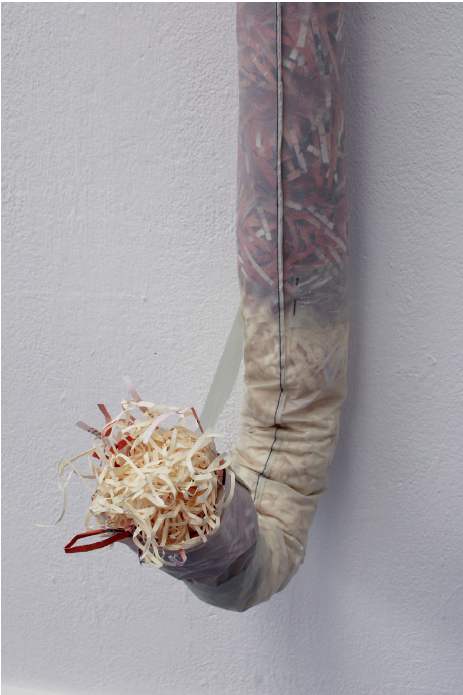
Détail de L'emprise, 2025